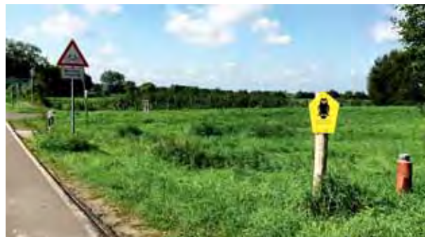
Mit Blick auf den Havelradweg

Ausdruck und Verwendung nur für den privaten Gebrauch