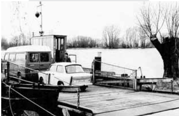
Die zweite Motorfähre

und Lehnin nach Kursachsen führte. Das Fährrecht ist der Stadt Ketzin seit 1375 verbrieft, und ein Fährmann taucht in einer Bürgerliste 1576 auf. Der letzte Fährmeister wird 1896 genannt. Bis 1906 wurde die Fähre im Handbetrieb geführt. Danach übernahm ein Motor die Arbeit und beförderte den Pram an einem Seil über die Havel. Am 24. April 1945 wurde bei Ketzin der militärische Ring um die Reichshauptstadt geschlossen. Damit wurde das Ende des Krieges besiegelt. Der Untergang der Fähre wurde durch die „unachtsame“ Nutzung eines Panzers in diesen Kriegstagen bewirkt. Nach dem Krieg wurde die Fähre wieder gehoben und fuhr noch bis in die 60er Jahre. Die darauf folgende Fähre wurde 1991 durch die noch heute in Betrieb befindliche Fähre „Charlotte“ ersetzt, die seither an einer Kette geführt wird. Heute sind die Fährmänner bei der Stadt angestellt und haben ein „Befähigungszeugnis zum Führen von Fahrzeugen in der Binnenschifffahrt“.