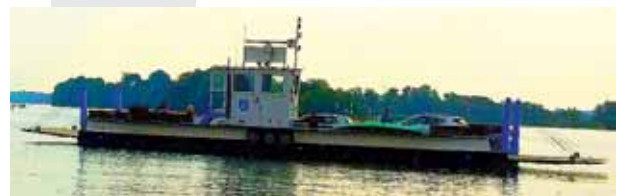
Fähre „Charlotte“ bei der Überfahrt