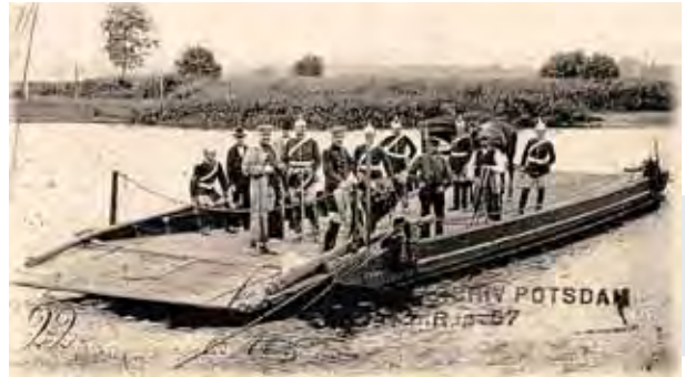
Die Fährten bei Ketzin/Havel im Handbetrieb