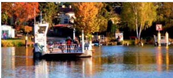
„Charlotte“ die heutige Motorfähre

Flachwasserbereich am Schmergowener Ufer