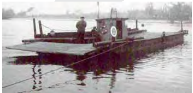
Die erste Fähre mit Motor