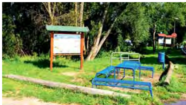
Rastplatz auf der Schmergowener Seite