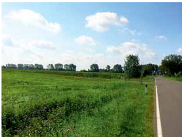
Ein Teil der Schmergowener Wiesen

Die Schmergowener Wiesen haben die Einrichtung von Extensiv-Grünland zum Ziel, über die Hälfte der zur Verfügung stehenden Fläche ist bereits zu Grünland umgewandelt worden. Dies dient dem Schutz des Bodens und der Unterstützung des Landschaftswasserhaushalts. Auch die gepflanzten Schutzhecken und Einzelgehölze dienen dem Schutz der Landschaft und verbessert die Lebensbedingungen für Tiere.