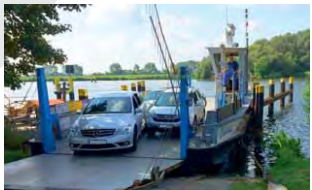
Fähre „Charlotte“ am Ketziner Ufer